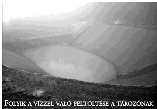
FOLYIK A VÍZZEL VALÓ FELTÖLTÉSE A TÁROZÓNAK

egészségesen készen vannak, a sífelvonók is elkészültek, a hóágyúrendszer is teljes egészében elkészült. A gyerek-sífelvonó telepítése van még hátra, ami napokon belül elkészül, valamint a terület rendezése, és terelő, biztonsági hálók kihelyezése van még hátra. Ha az időjárás is engedi, december második hetében megkezdődik a sípálya behavazása, mivel a rendszer működtetéséhez szükséges víz már rendelkezésre áll, már csak a tartósan 0 fok alatti hőmérsékletre van szükség ahhoz, hogy valóban megkezdje működését az új hóágyúrendszer, és beüzemeljen a II.-es sípálya.