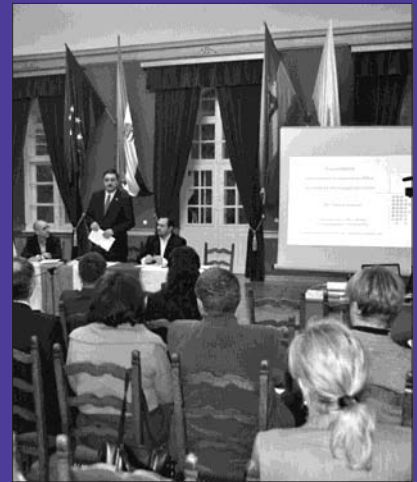
Világörökség konferencia - 2. oldal