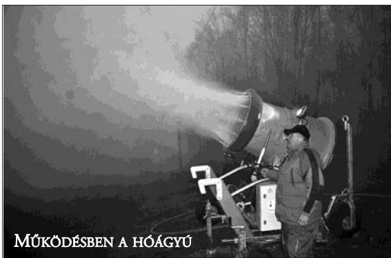
MŰKÖDÉSBE A HÓÁGYÚ

Ennek egyik fontos előfeltétele volt, a víztározó elkészülte, és feltöltése vízzel. A vízzel való feltöltés már elkezdődött, ami még egy hosszabb folyamat, hiszen óriási mennyiségű víz, 14 ezer m 3 lesz tárolva az új víztározóban. Első ütemben 8 méter magasságig töltik fel a medencét, majd ha a völgygát betonozása a teljes magasságban elkészül, akkor lesz a medence teljes egészében feltöltve.