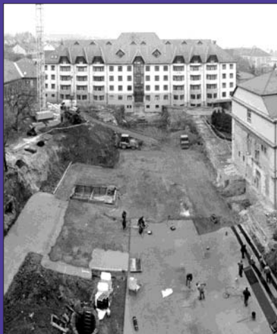
Tartják az ütemtervet kivitelezők - 2. oldal