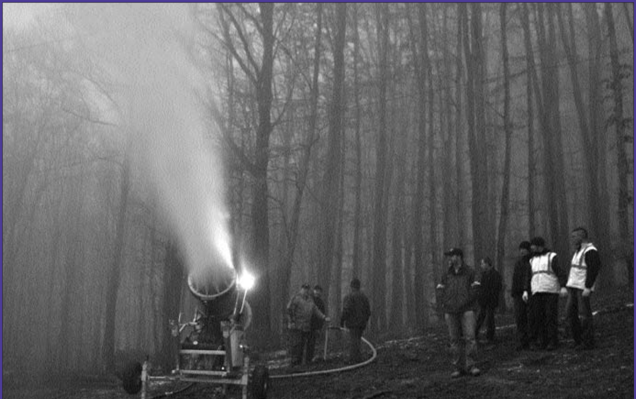
Beüzemelték az új hóagyút a Magas-hegyen - 3- oldal